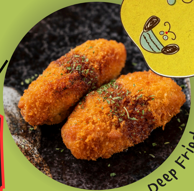
Sakusaku... Deep Fried oysters