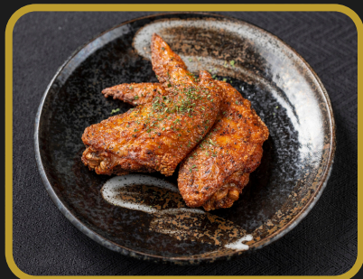
運命を変える手羽先 650