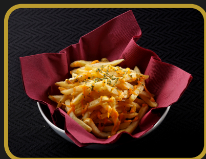
トリュフ薫るフライドポテト 990