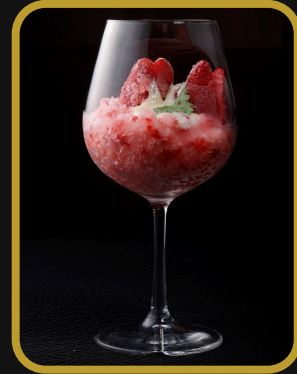
果肉たっぷり いちごみるくかき氷 880