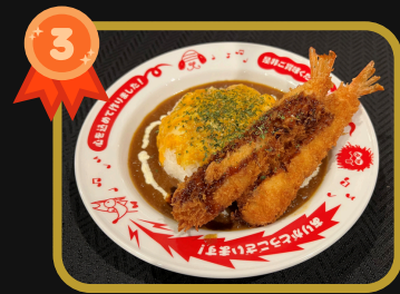
エビフライ×チーズ