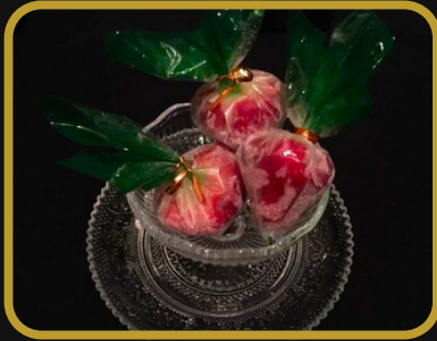
いちごと練乳の幸せアイス 550