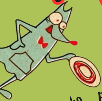
PotePote... French Fries